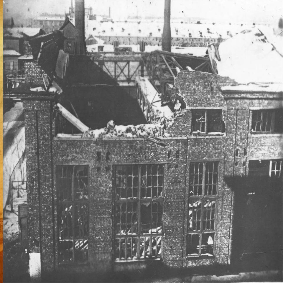
Кировский завод в годы Блокады

Семья моего прадеда на момент Блокады была не маленькой – в месте с ним переживали ужасы голода и холода мама, десятилетний брат и две, совсем ещё маленькие сестрёнки, младшей из которых был всего лишь год. Всячески пытаюсь помочь им и страдающей от войны стране, прадедушка, будучи ещё совсем юным, устраивается работать на Кировский завод.